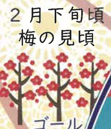
2月下旬頃 梅の見頃