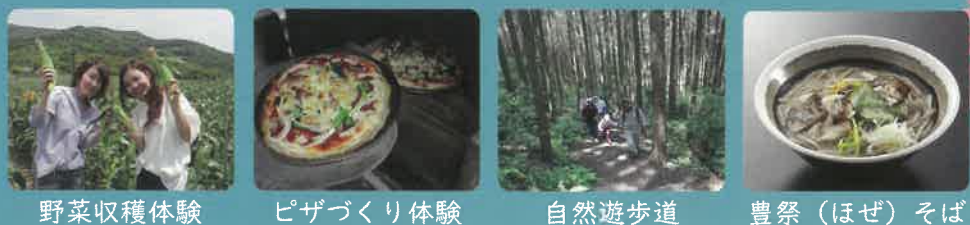
野菜収穫体験 ピザづくり体験 自然遊歩道 豊祭(ほぜ)そば

③ グリーンファーム (鹿児島市観光農業公園) 年間を通じて、旬の野菜収穫やピザづくり、黒豚ウインナーづくりなどの各種体験プログラムを行っています。農産物直売所や農園レストラン、キャンプ場、自然遊歩道、遊具などもあり、日帰りから宿泊まで楽しむことができます。また、園内には藩政時代の放牧の名残を今に伝える「喜入牧のオロ跡」などの史跡もあります。