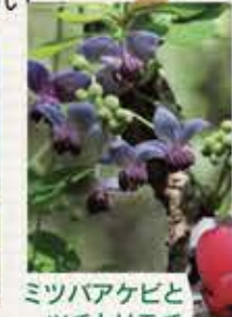
ミツバアケビとツチトリモチ