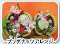
ブッダナッツアレンジ