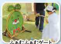
ふあむふあむゲート